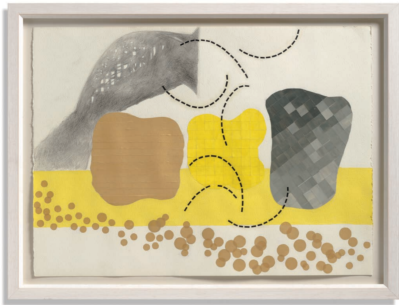
ЗЛАТНА ОБАЛА , 2017, цртеж и колаж, 56 x 76 cm