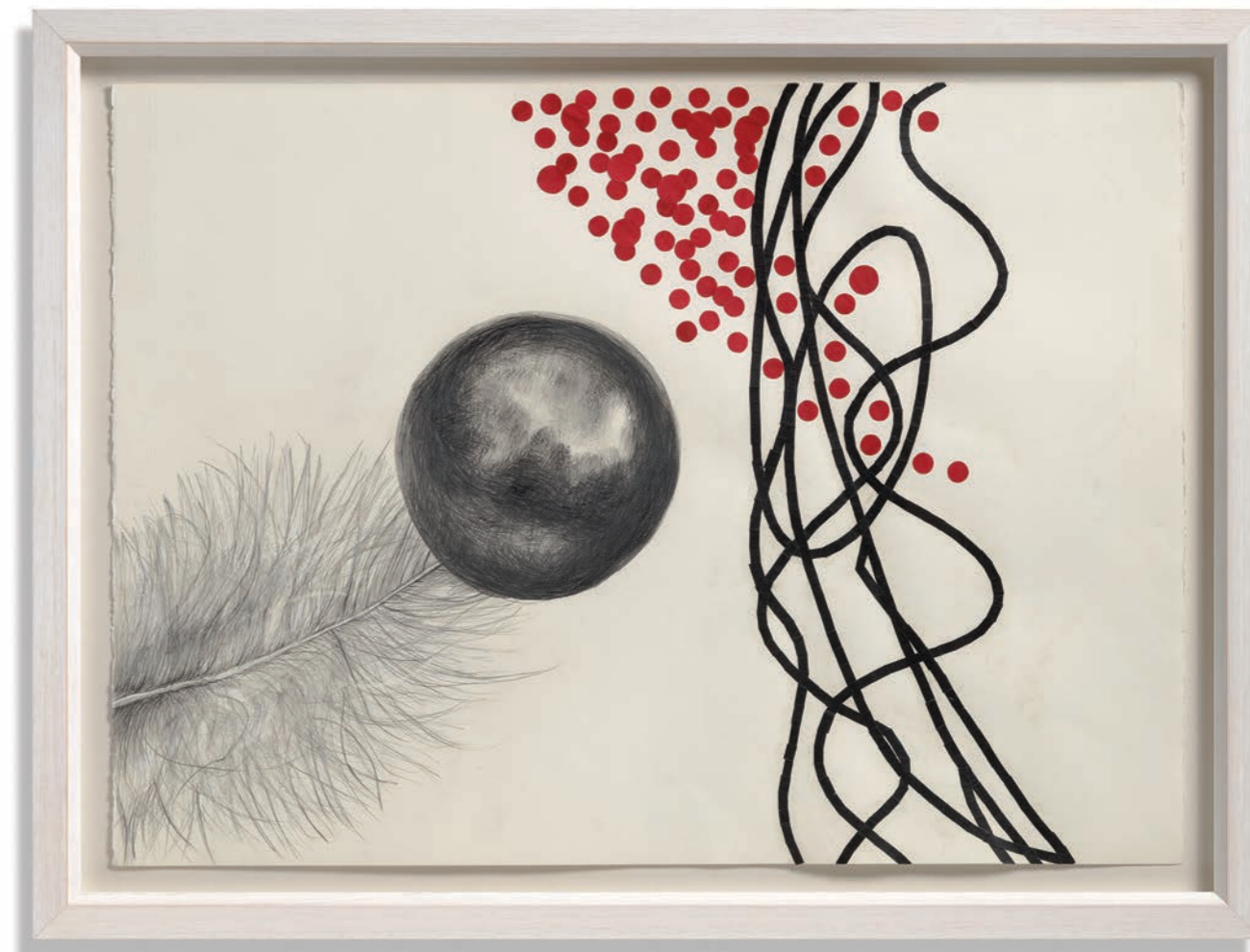
МЕРА ОПСТАНКА , 2017, цртеж и колаж, 56 x 76 cm