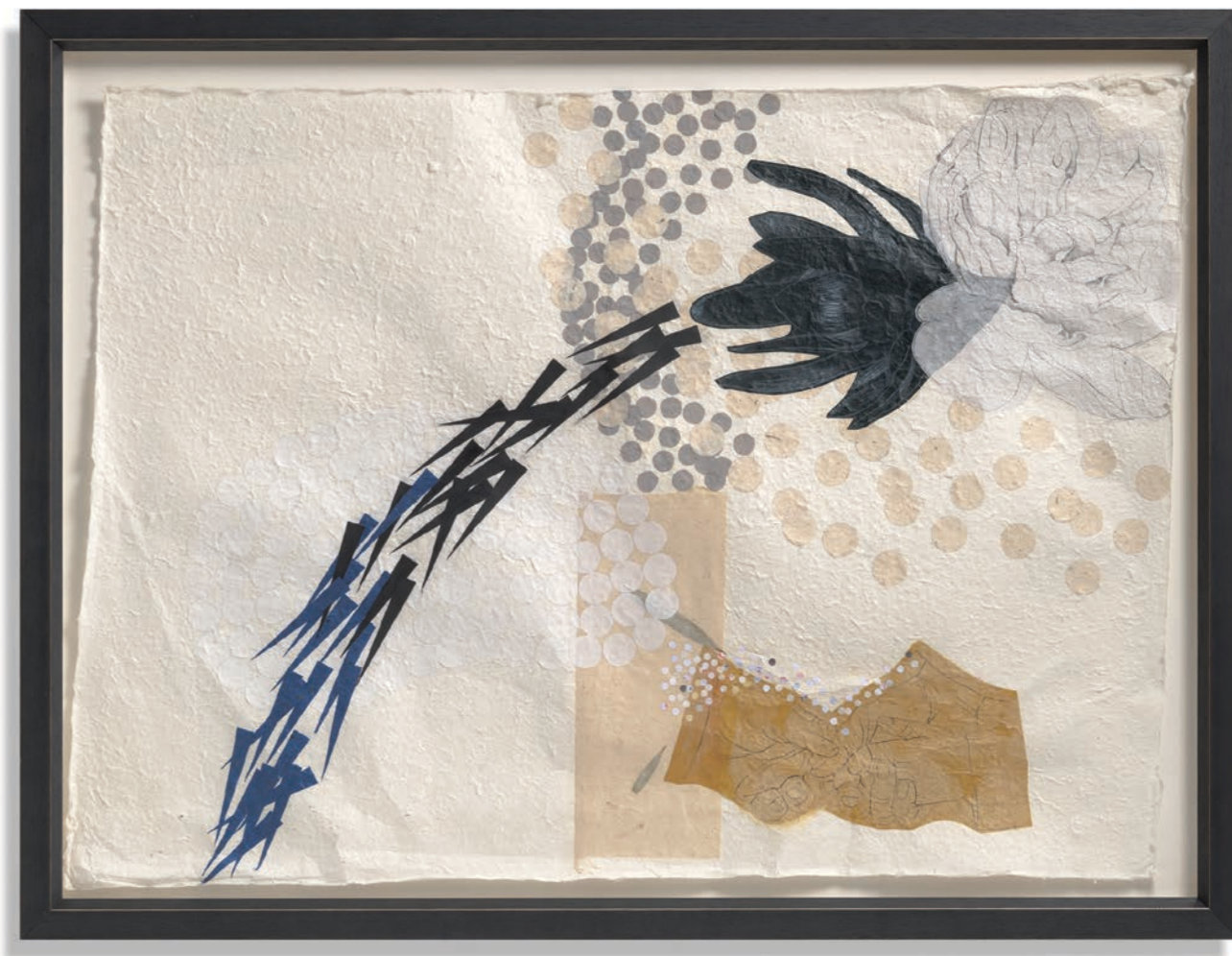
ОДСУСТВО , 2018, цртеж и колаж на ручном папиру, 65 x 90 cm