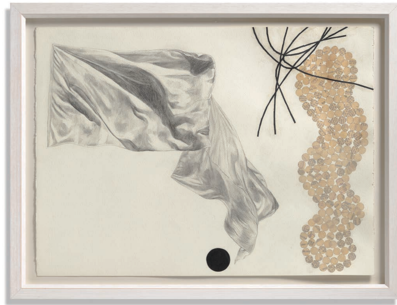
ПРЕДАЈА , 2017, цртеж и колаж, 56 x 76 cm