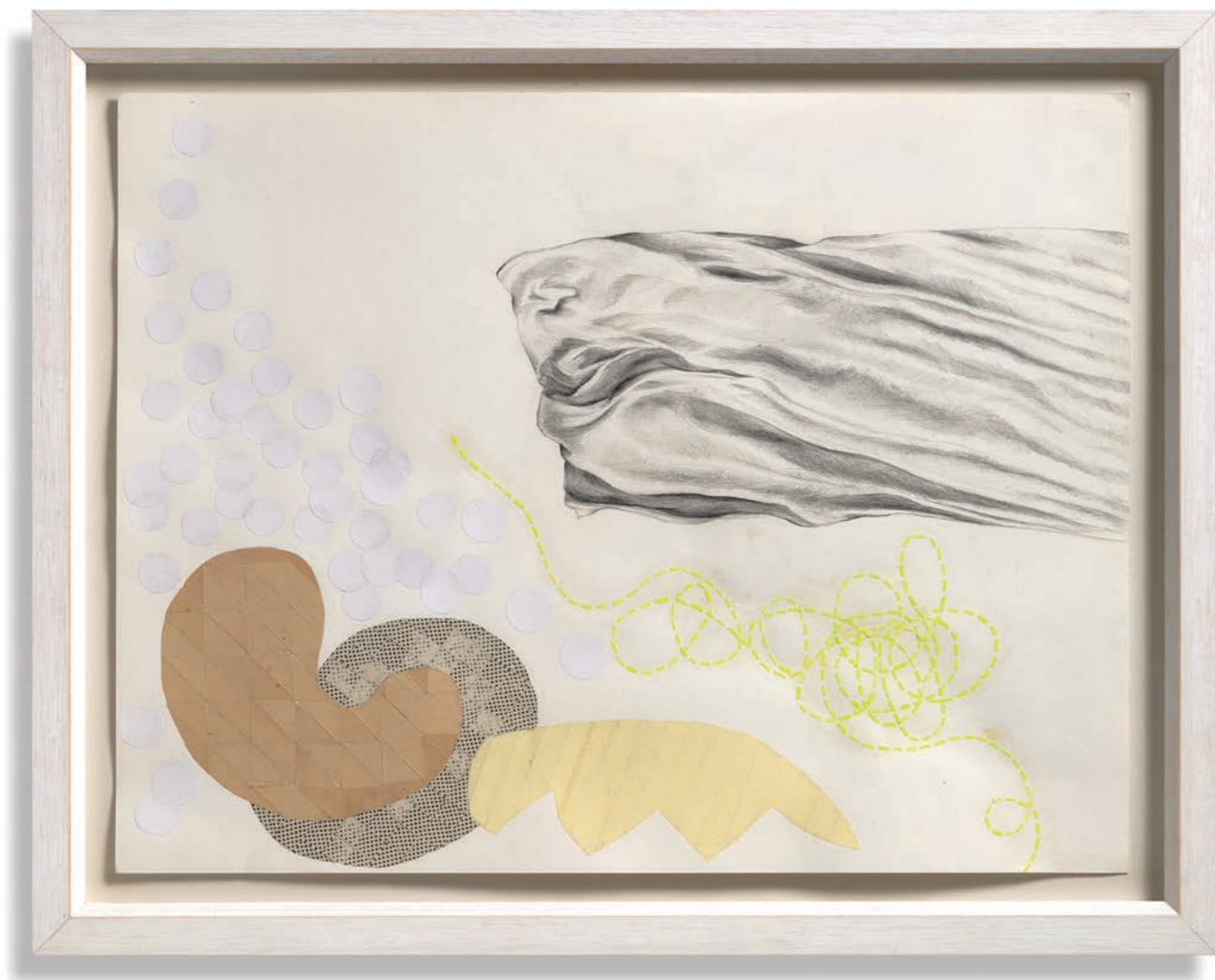
ПРЕДАЈА , 2017, цртеж и колаж, 56 x 76 cm