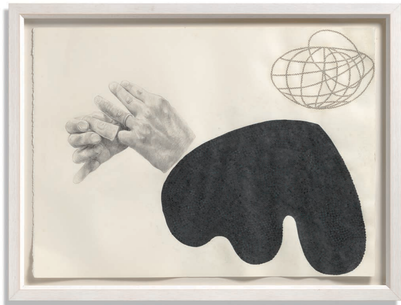
ПОСЛЕДИЦЕ , 2017, цртеж и колаж, 56 x 76 cm