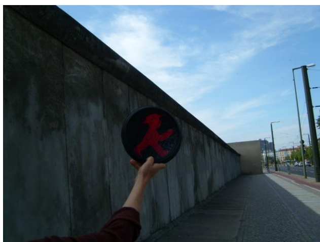
Bernauerstrasse, jedino mesto gde je sačuvan originalan deo zida