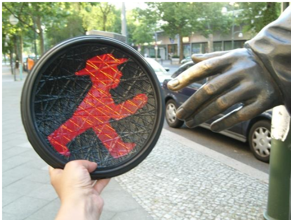
Stvaranje čoveka koji se krije u svakom od nas Budapesterstrasse, spomenik Alexander von Humboldt-u, naučniku i istraživaču