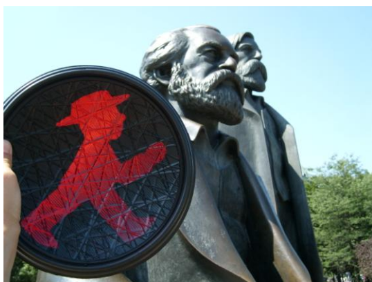
Trg Marx-a i Engels-a, spomenik Marksu i Engelsu; rad Ludwig Engelhart-a, podignut 1986

U trećoj seriji istražujem spomenike kao odraz našeg odnosa sa sopstvenom prošlošću i kao slike društva u periodu u kom se nalazi.