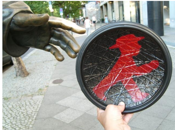
Stvaranje čoveka koji se krije u svakom od nas... Budapesterstrasse, spomenik Alexander von Humboldt-u, naučniku i istraživaču