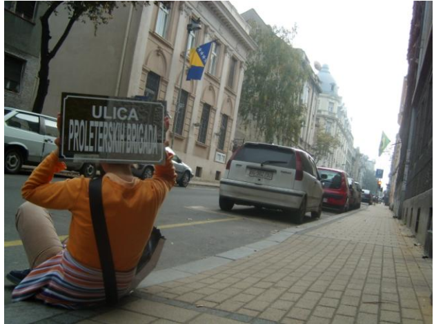
Kruska ulica, ambasada Bosne I Hercegovine