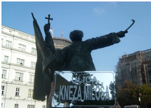
Ulica Kneza Miloša, spomenik Kneuz Milošu, kopija spomenika "Takovski ustanak" iz 1900-te, rad Petra Ubavkića, postavljen 2004. Na ovom mestu nalazila se bista Borisa Kidriča koja je premeštena u blizinu Muzeja Savremene Umetnosti