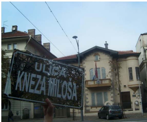
Ulica Kneza Miloša, ambasada Republike Hrvatske