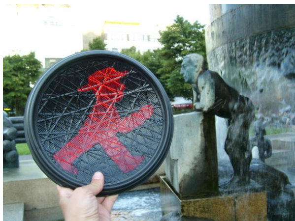
Fontana na Wittenbergplatz koja je pripadala Zapadnom Berlinu