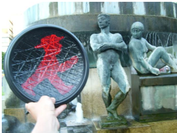
Fontana na Wittenbergplatz koji je pripadao Zapadnom Berlinu