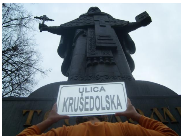
Krušedolska ulica, spomenik Svetom Savi, podignut 2003, poklon ruskog vajara Vjačeslava Mihajloviča